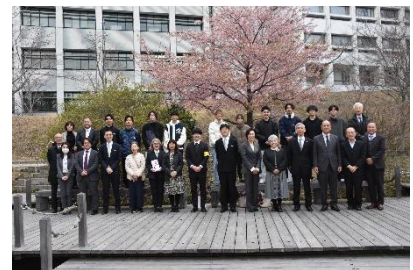
■終了後の記念撮影